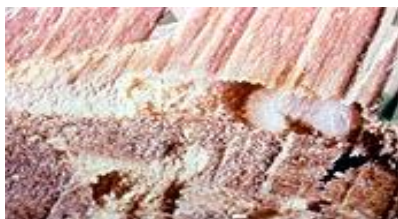
Larve kleine Houtwormkever

Dosering is 250 ml per m 2 hout. De vereiste hoeveelheid zo nodig in meer dan één bewerking opbrengen.