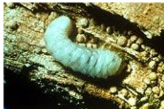
Larve grote Houtwormkever